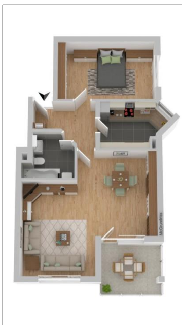
Grundriss 3D WE07