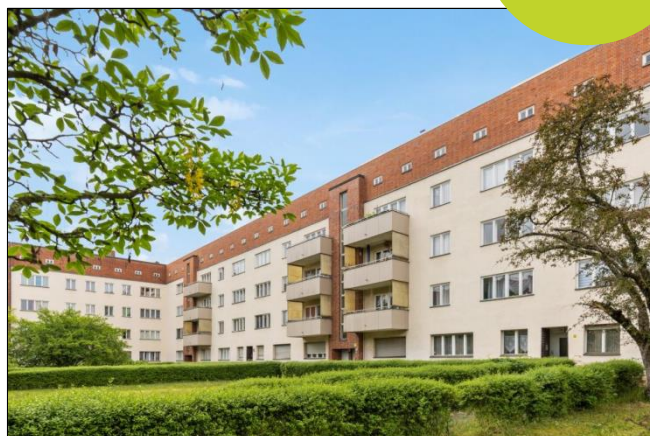
Ollenhauer Straße 85-96