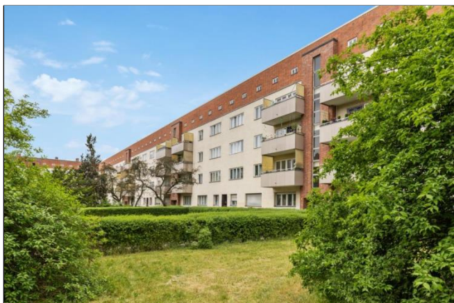
Ollenhauer Straße 85-96