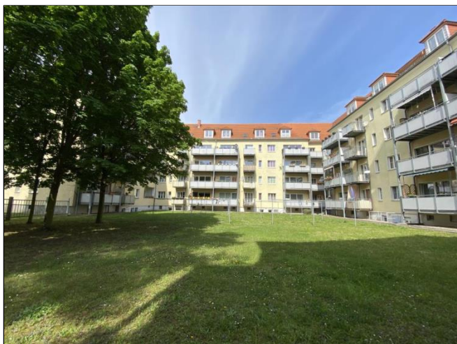
Haus- und Grundstücksansicht