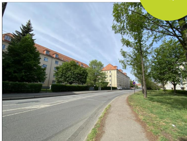
Straßenansicht / Lage